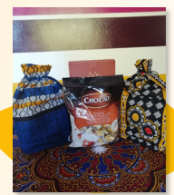
Scatola praline di cioccolato art. 18