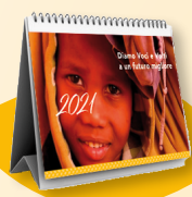
Calendario da tavolo art. 2