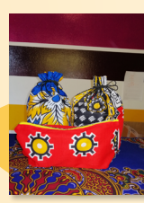
Confezione prodotti bagno e creme art. 10