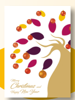
Biglietti di auguri art. 1

Uno scaffale da riempire VITABU FOR MAMBA Dona il 5 X 1000 Cod. Fisc. 93153030239