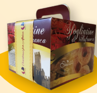
Le sfoogliatine di Villafranca art. 5