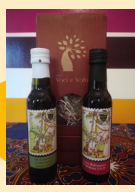
Confezione olio e aceto balsamico art. 9