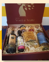
Cofanetto prodotti frantoio art. 8