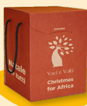
Pandoro/Panettone 750 g art. 3 Pandoro/Panettone Spumante art. 17