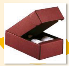
Valpolicella superiore Lavarini + Ripasso Lavarini art. 16