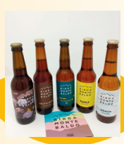
Confezione 5 birre artigianali da 33 cl. art. 11